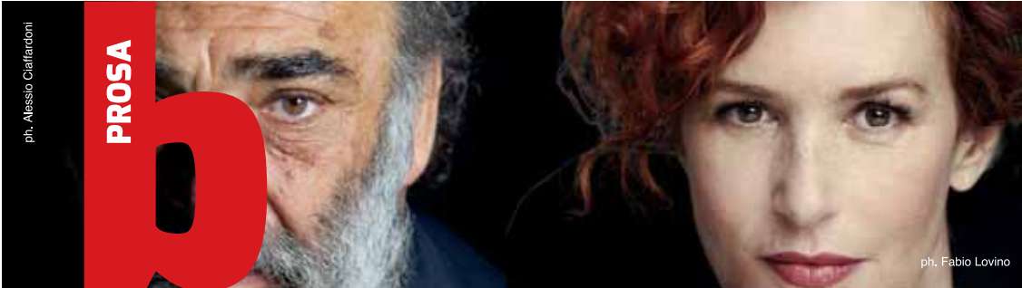
ph. Fabio Lovino