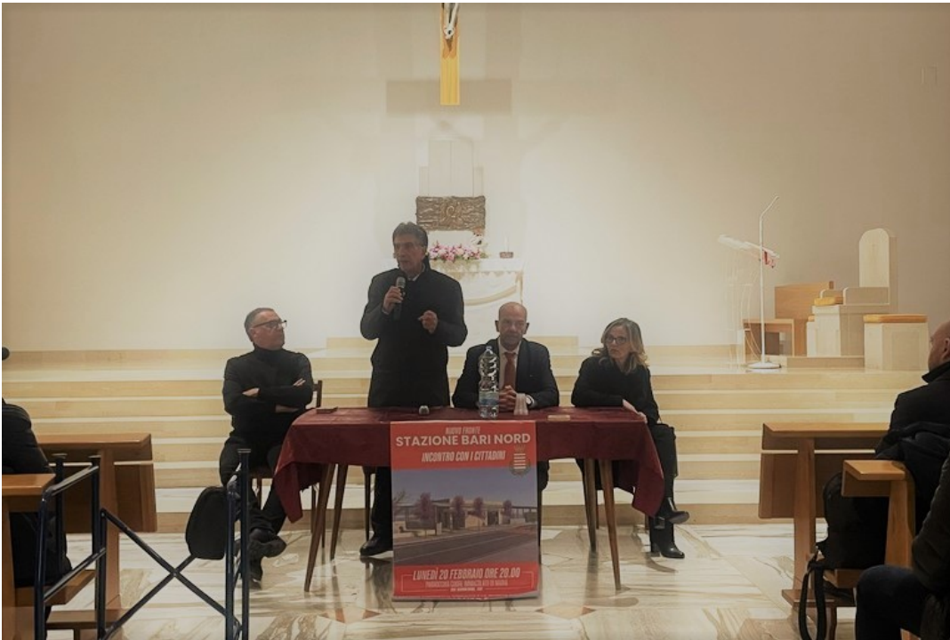
Incontro su lavori fronte stazione