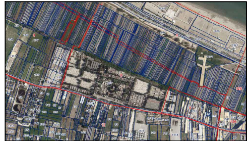
STRALCI CATASTALI SU ORTOFOTO