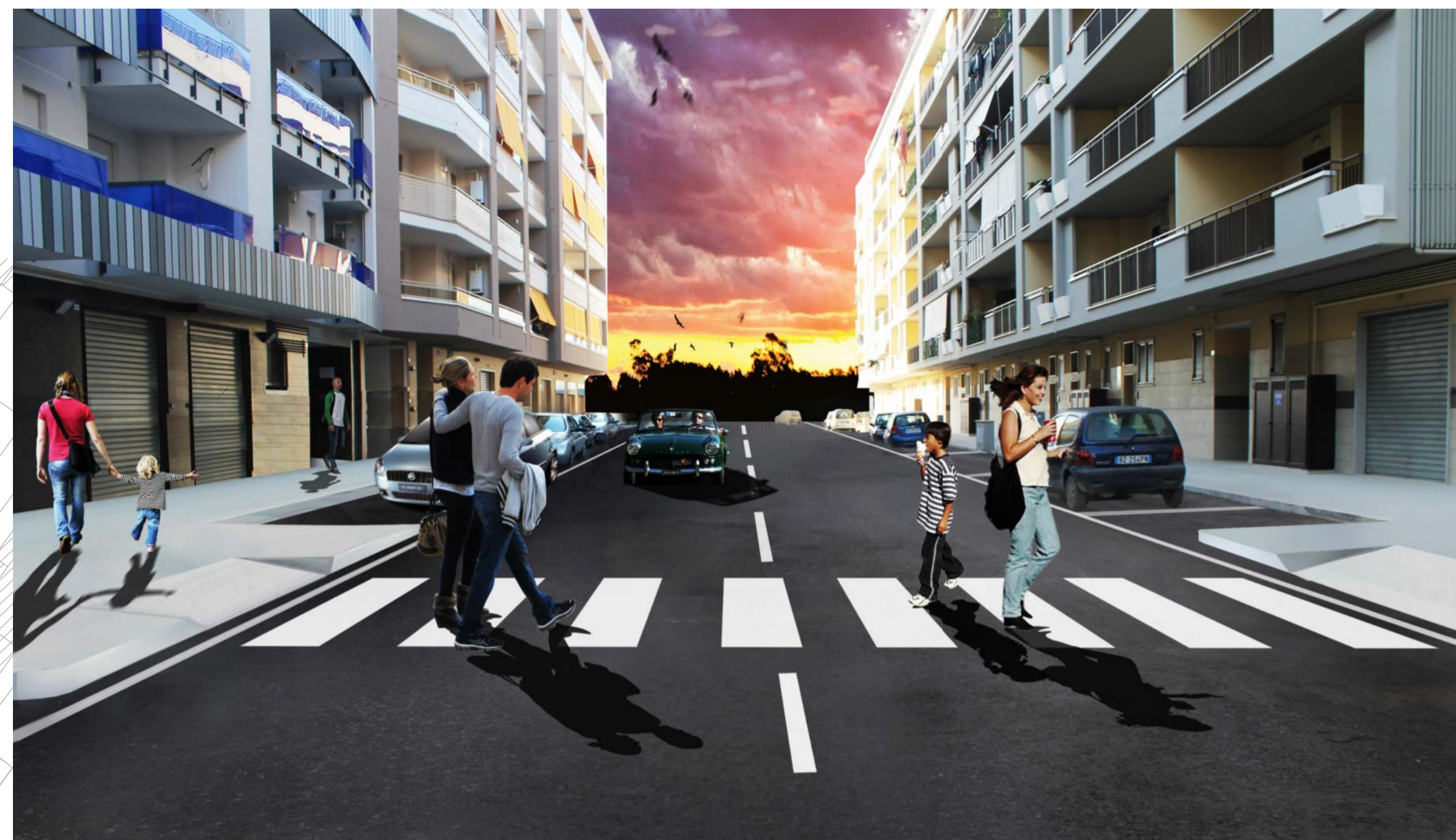
VISTA PROSPETTICA DI PROGETTO TRATTA 073