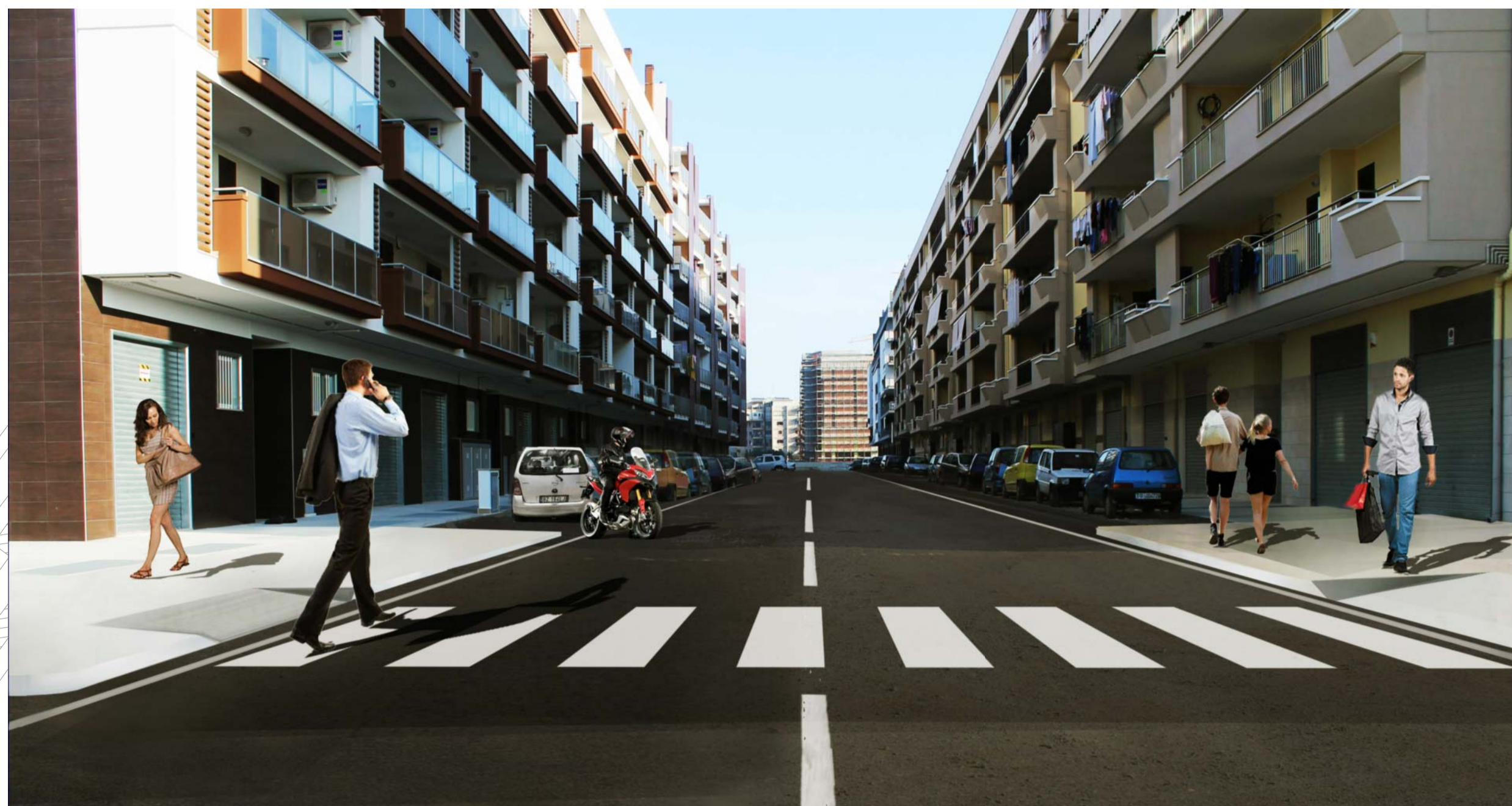
VISTA PROSPETTICA DI PROGETTO TRATTA 071