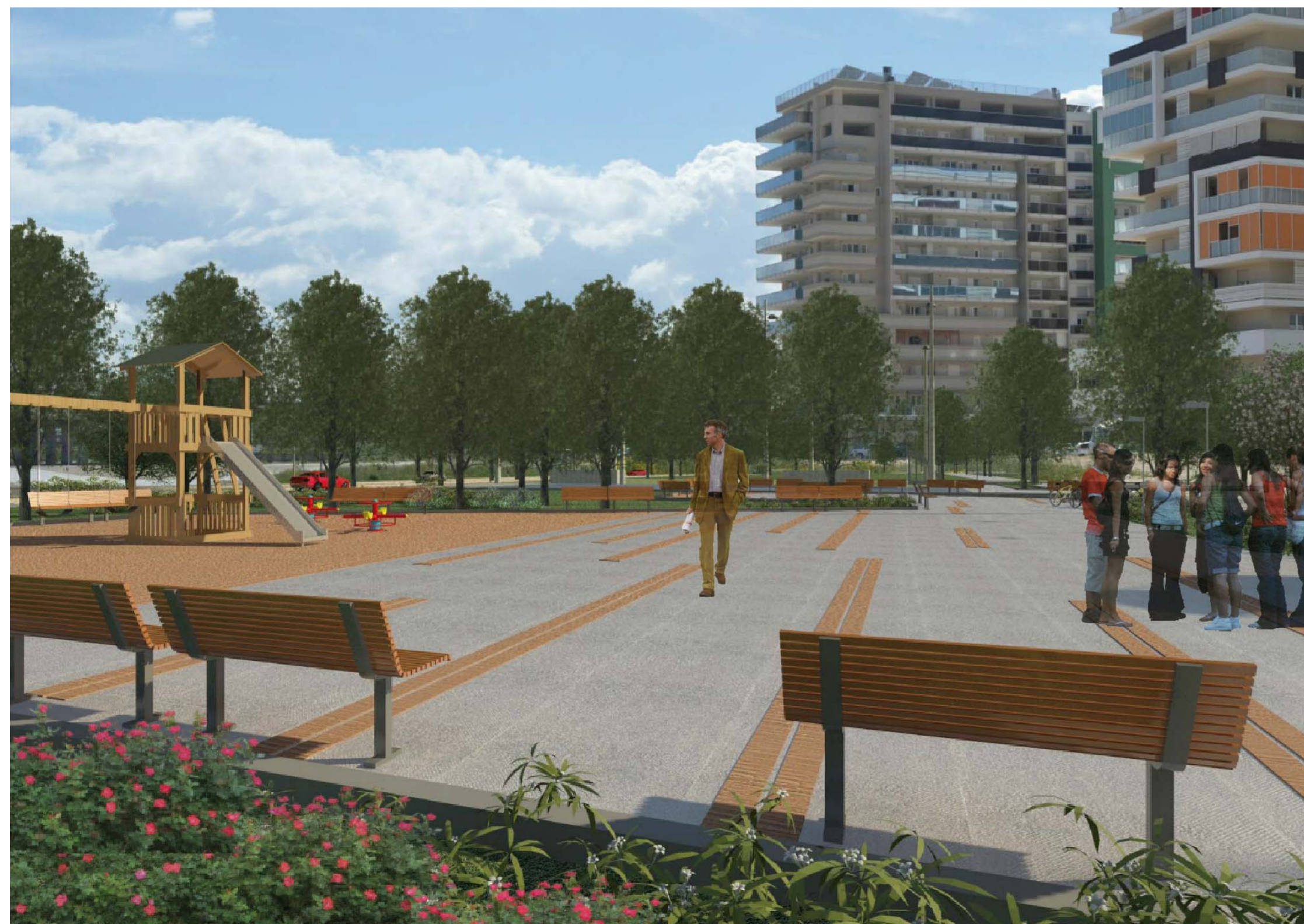
RENDER E SIMULAZIONI FOTOGRAFICHE NUOVO PARCO DANTE