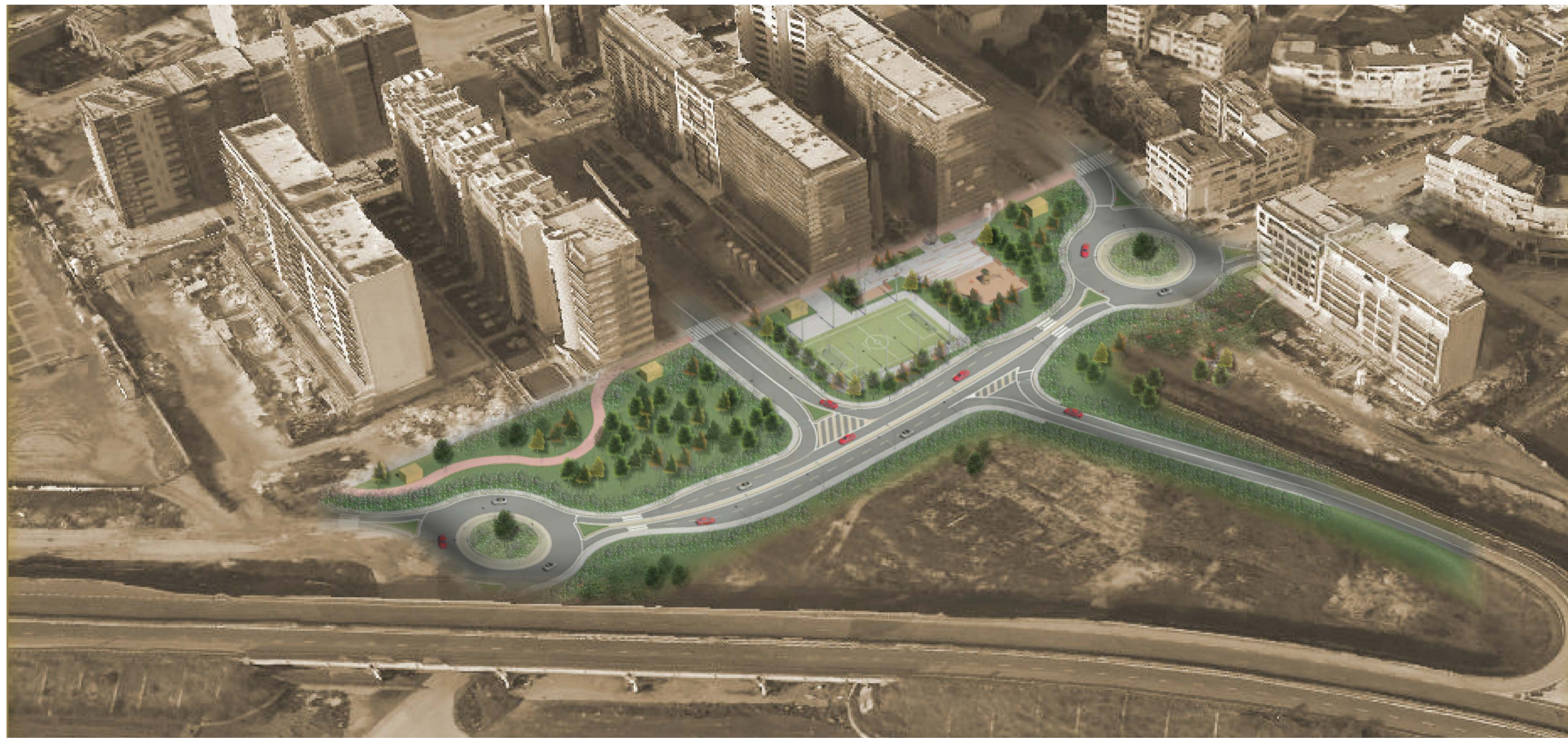
PLANIMETRIA STATO DI PROGETTO NUOVO PARCO ATTEZZATO DANTE