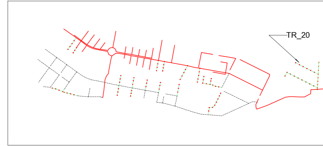
KEY-PLAN - FOGNA NERA - PROFILI DI PROGETTO - TRATTA 100 - PROFILO TR_21