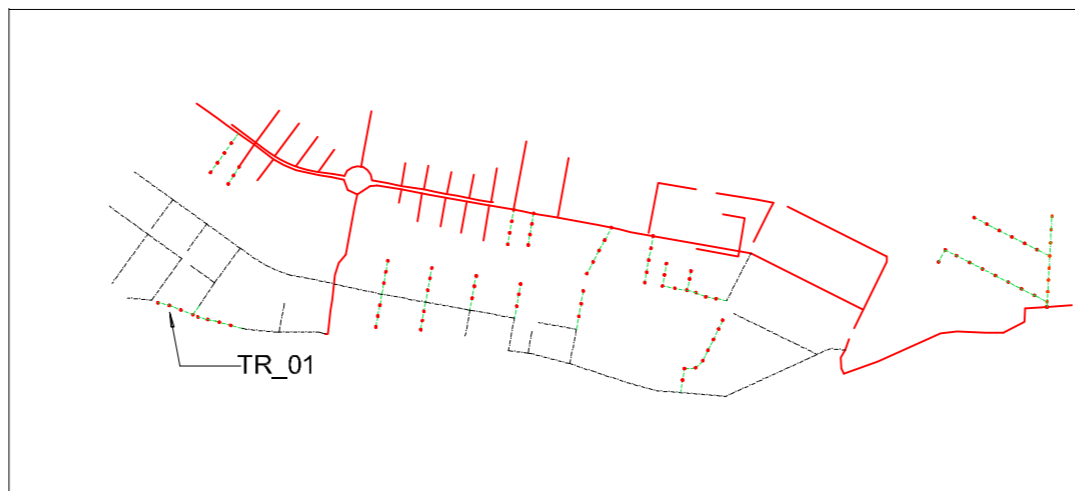
KEY-PLAN - FOGNA NERA - PROFILI DI PROGETTO - TRATTA 073 - PROFILO TR_01