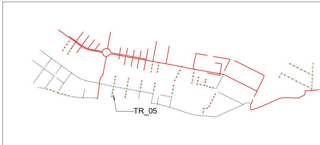
KEY-PLAN - FOGNA NERA - PROFILI DI PROGETTO - TRATTA 081 - PROFILO TR_05