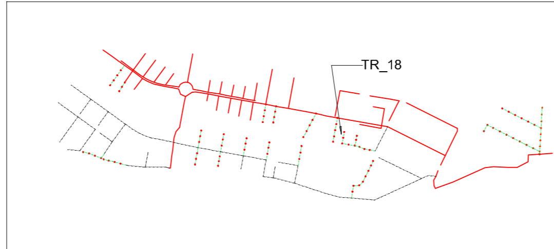
KEY-PLAN - FOGNA NERA - PROFILI DI PROGETTO - TRATTA 101 - PROFILO TR_18