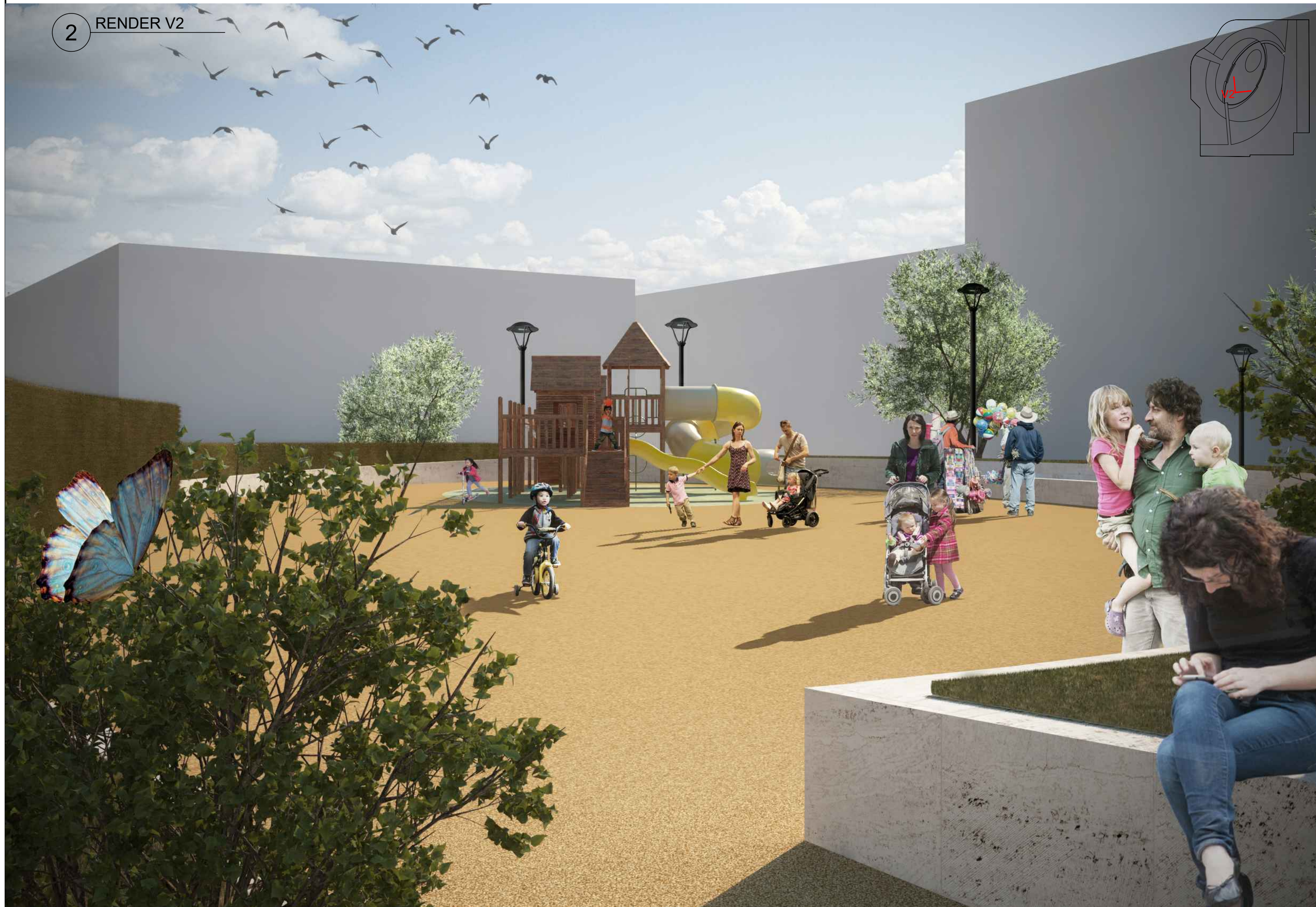
2 RENDER V2