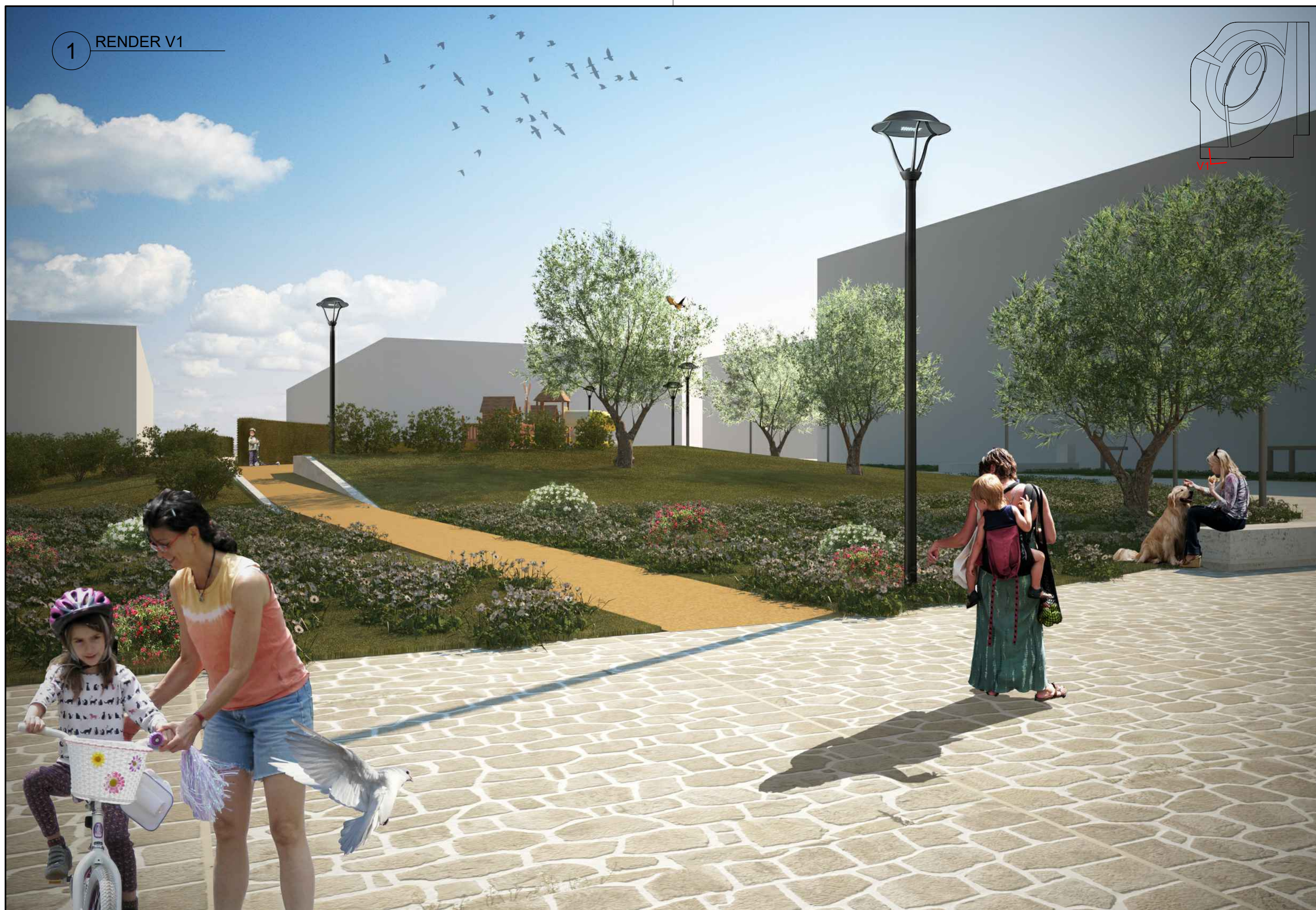
1 RENDER V1