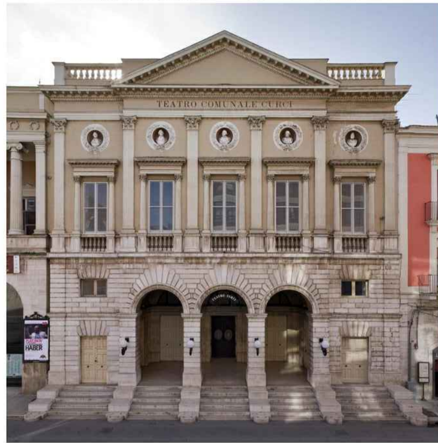
VARIANTE DI PROGETTO DEGLI INTERVENTI