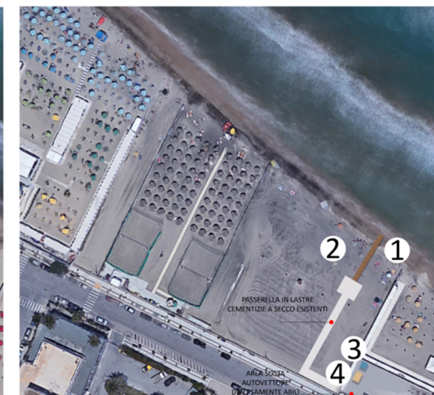
• ACCESSO PER DIVERSAMENTE ABILI AL MARE DI LEVANTE