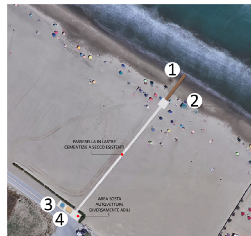
• ACCESSO PER DIVERSAMENTE ABILI AL MARE DI PONENTE

4 Casetta in legno per deposito attrezzi e spogliatoio. 240 cm x 216 cm x 233 cm (h)