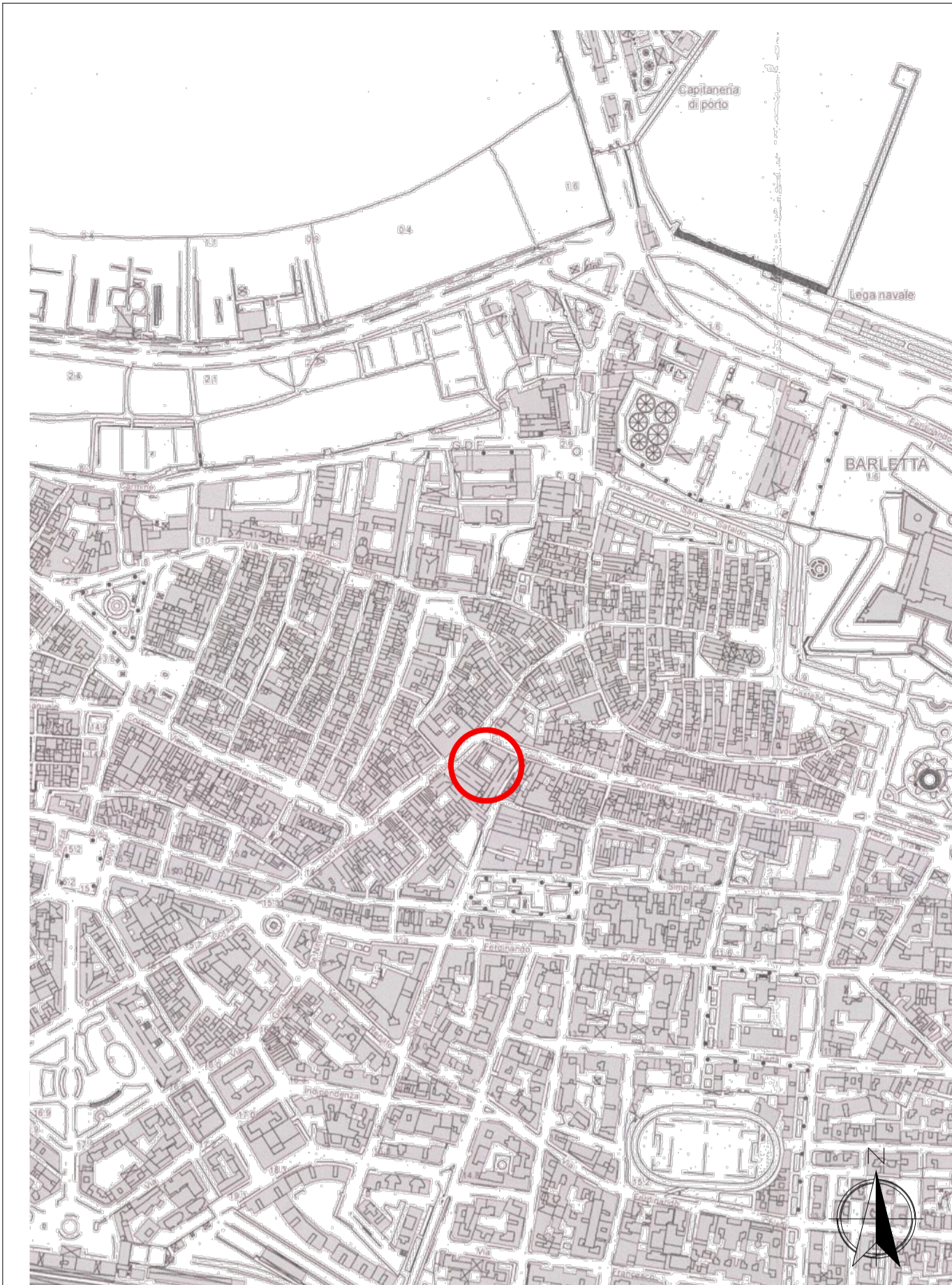
C.T.R. - SCALA 1:5000

1. Nella zona omogenea "A - Centro antico", il PRG persegue la tutela del patrimonio artistico storico tipologico ed ambientale attraverso la conservazione e la valorizzazione sia dei monumenti singoli e degli insiemi monumentali (tutelati o tutelabili ai sensi del titolo I del D.v.o 490/1999 (già l.n.1098/1939), sia degli edifici e degli insiemi edilizi d'interesse ambientale (tutelati o tutelabili ai sensi del titolo II del D.v.o 490/1999 (già l.n.1497/1939), sia degli edifici e degli insiemi ritenuti di interesse per la storia del Comune (tutelati attraverso il PRG e/o i PP da esso prescritti).