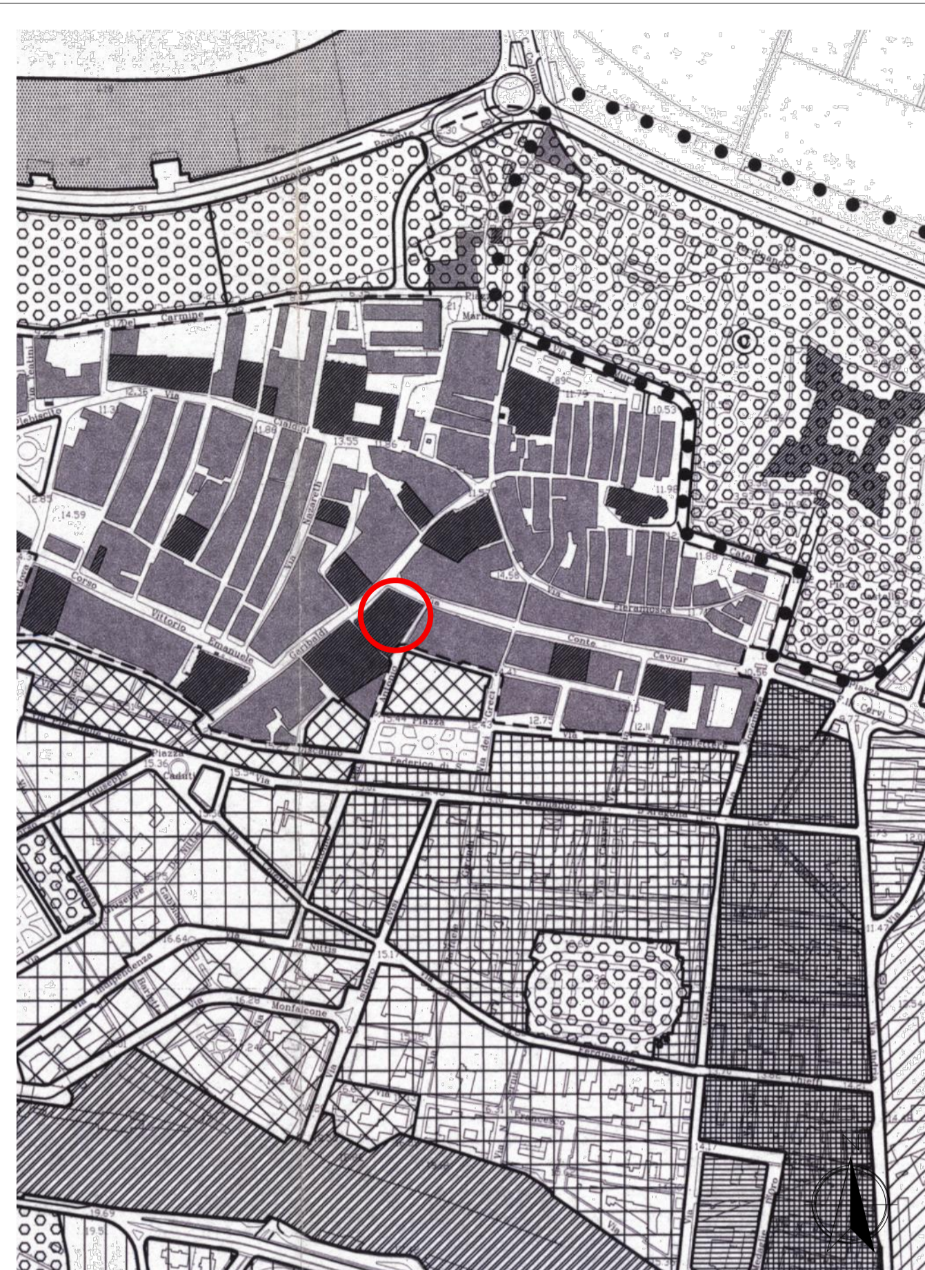
P.R.G. - SCALA 1:5000