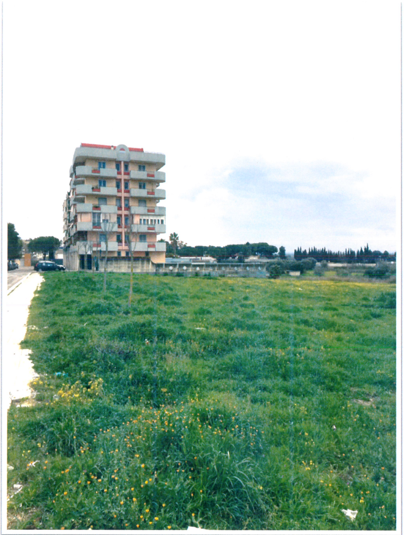
Foto area intervento direz. SUD