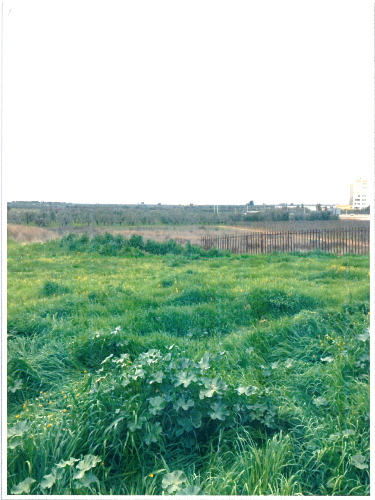
Foto area intervento direz. NORD-OVEST